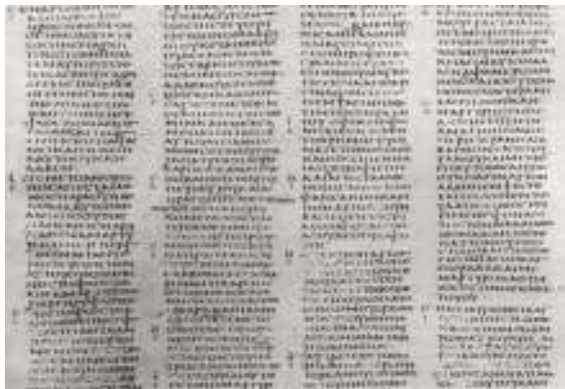
Copia de San Juan 1 en griego (Siglo 4)

autores del NT citaron el AT, no ocuparon el hebreo, sino la traducción del hebreo al griego, (es decir la septuaginta) y por eso encontramos pequeñas diferencias. Lo importante de esto es que bajo la dirección del Espíritu Santo, los autores del NT ocuparon una traducción cuando citaban el Antiguo Testamento.]