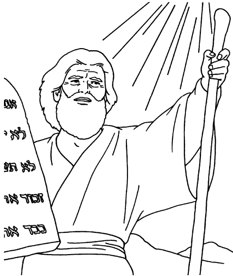
Illustration by Nan Pollard © 1998 Standard Publishing. Used with permission.

Dios mismo formó las palabras con su propio dedo, dice el libro de Éxodo. Dice la palabra que la gloria de aquel evento era tan grande que los hijos de Israel no pudieron fijar la vista en el rostro de Moisés. Ahora, fíjese. Como saben ustedes, el idioma y cultura de más prestigio en aquel